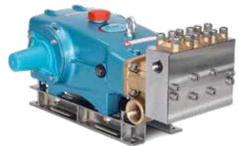
Modelo 3560 20 gpm (76 lpm), 4000 psi (276 bares)