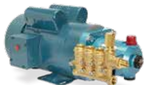
4DX10ER con motor eléctrico