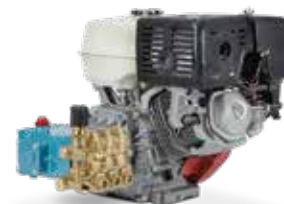
66DX40G1I con motor de combustión

Potencia (HP) del motor eléctrico: \text{gpm} \times \text{psi} / 1460 . Para conocer la potencia requerida del motor, comuníquese con el fabricante.