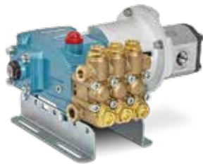
5CP3120CSS con motor SAE