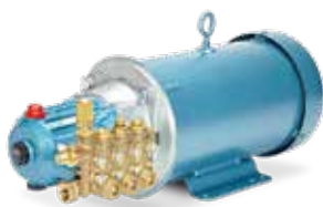
5SP35ELU con motor eléctrico

NOTA: Todas las bombas con velocidad nominal de 3450 rpm pueden operar a 1725 rpm y así reducir el flujo un 50 %. Potencia (HP) del motor eléctrico: gpm x psi / 1460.