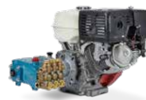
5CP3120CSSG1 con motor de combustión

Potencia (HP) del motor eléctrico = \text{gpm} \times \text{psi} / 1460 . Para conocer la potencia requerida del motor, comuníquese con el fabricante.