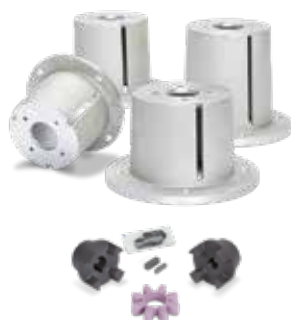
Campana / acoplamiento flexible

Potencia (HP) del motor eléctrico: gpm x psi / 1460.