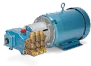
5CP3120CSS con campana, motor